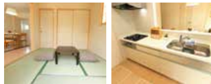
※家具類は価格に含まれません